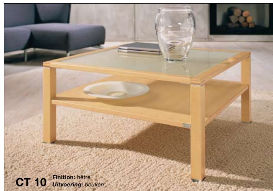
CT 10 Finition: hêtre Uitvoering: beuken

Vierkant of langer dan breed: de 45 cm hoge CT 10 is verkrijgbaar in de maten 70 x 70, 90 x 90 en 120 x 70 cm. Het bovenste blad kan, geheel volgens uw wensen, bestaan uit hout, aan de achterzijde gelakt glas in wit of zand, helder glas, gesatineerd of getint glas. Het onderste blad is altijd van hout.