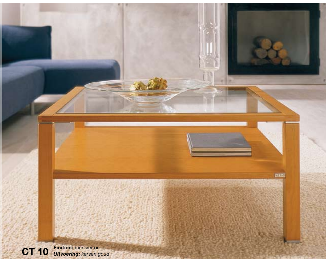
CT 10 Finition: merisier or Uitvoering: kersen goud