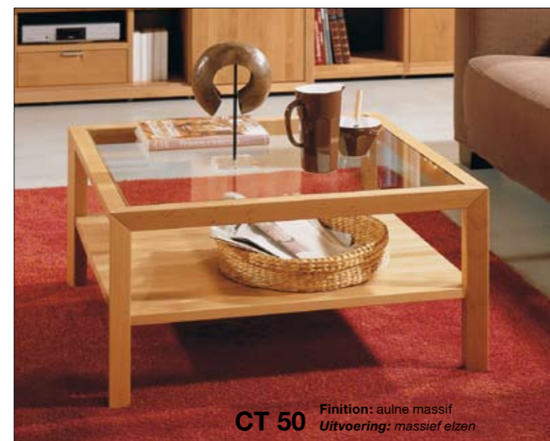
CT 50 Finition: aulne massif Uitvoering: massief elzen

Une plus grande comme point central d'un groupe d'assise, une plus longue en tant que table d'appoint? La table basse CT 50 est disponible dans les dimensions 70 x 70, 90 x 90 et 120 x 70 cm.