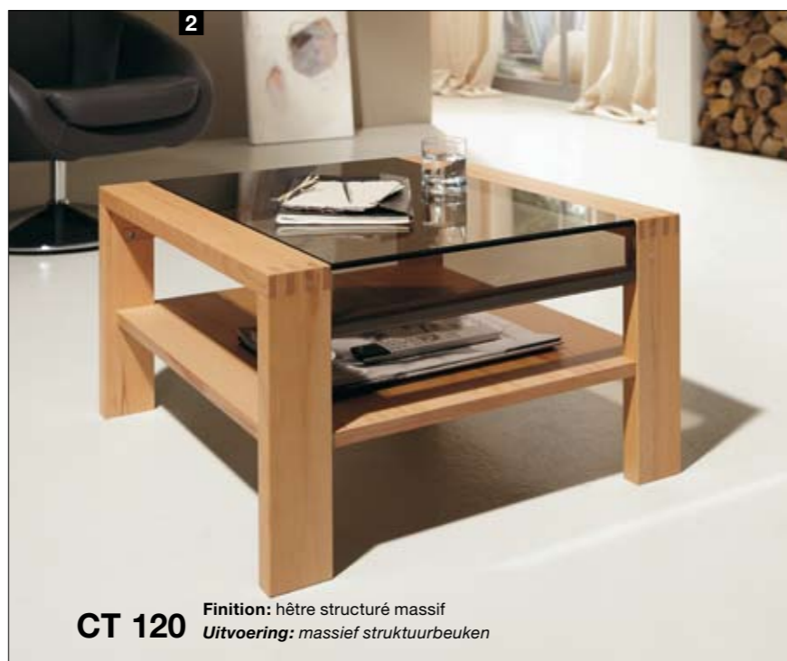
CT 120 Finition: hêtre structuré massif Uitvoering: massief structuurbeuken

Minder is meer! De CT 120 is dankzij het doordachte design en het massieve houten pootstel ook zonder schuiflade een lust voor het oog. Of als klein vierkant in de afmetingen 70 x 70 cm of iets groter in 90 x 90 cm.