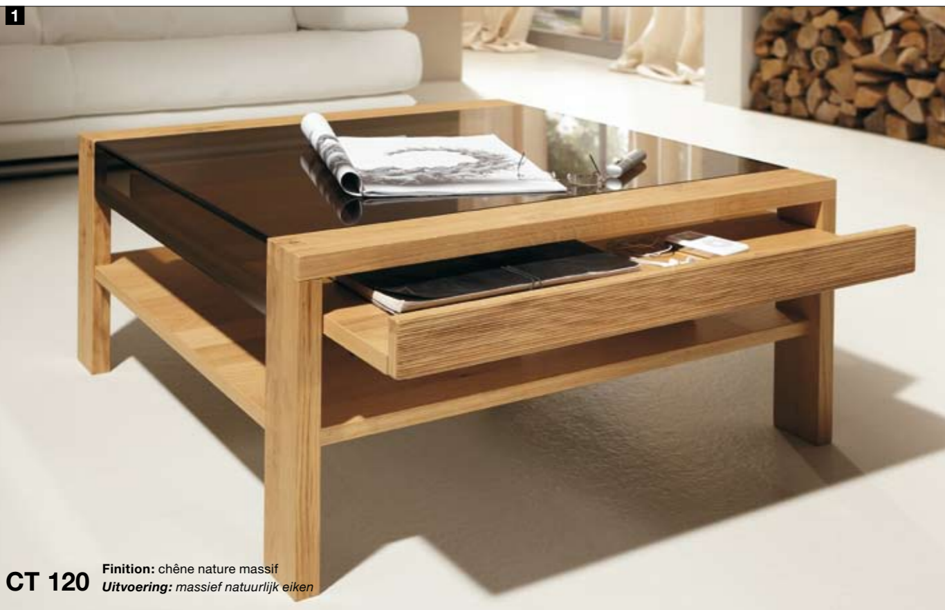
CT 120 Finition: chêne nature massif Uitvoering: massief natuurlijk eiken

Cocooning, het zich terugtrekken in huiselijke kring, is een jonge trend die wereldwijd door veel mensen wordt gevolgd. De Duitse gezelligheid kent een lange traditie, is uniek in haar soort en heeft eveneens veel vrienden. hülsta geeft haar met twee nieuwe salontafels een nieuwe, frisse uitstraling die overal weerklank vindt. Typisch hülsta.