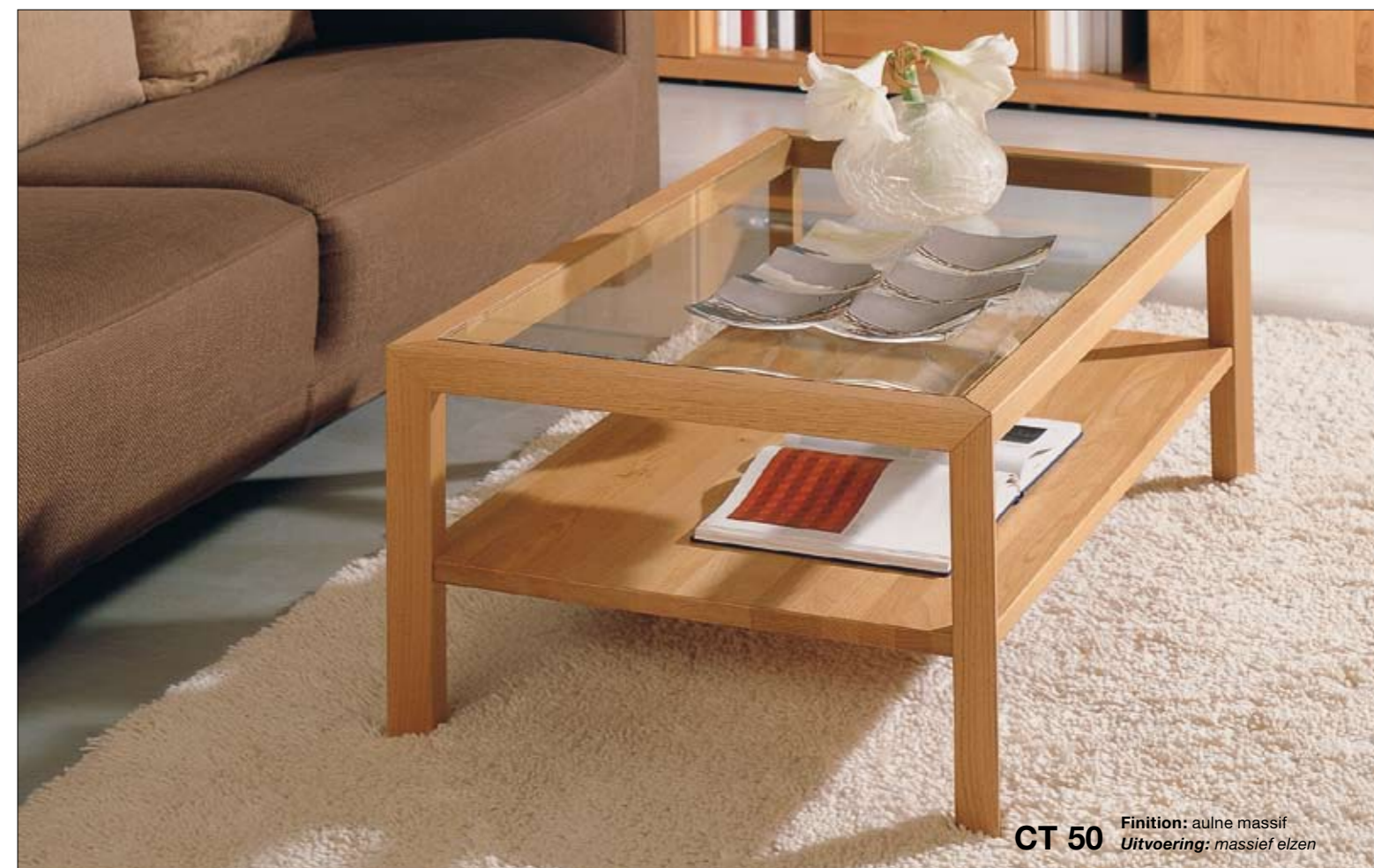
CT 50 Finition: aulne massif Uitvoering: massief elzen

Carrée ou plus longue que large: la table basse CT 10 de 45,0 cm de haut existe dans les dimensions 70 x 70, 90 x 90 et 120 x 70 cm. Le plateau supérieur peut – selon vos souhaits – être en bois, en verre laqué blanc ou sable sur face arrière, en verre clair, satiné ou teinté. Le plateau inférieur est toujours en bois.