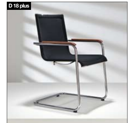
D 18 plus Chaise à structure souple/Buisframestoel Piètement: chrome brillant/ch. mat, avec ou sans acc., assise et dossier avec revêtement tricoté sur mesure (transparent/surface assise opaque). Frame: hoogglaans/mat chroom, met/zonder arMLEUNINGEN, bekleding opengewerkt tricot (transparant/zitting ondoorzichtig).