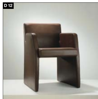
D12 Fauteuil rembourré Accoudoirs d'un seul tenant, coutures exactes, façonnées de manière minutieuse Gecapitonneerde stoel Doorlopende arMLEUNINGEN, nauwkeurig, hoogwaardig gemaakte naden