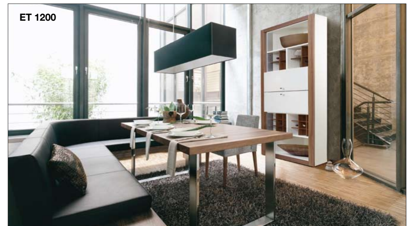
ET 1200 Finitions: laqué blanc, noyer, hêtre structuré, chêne anthracite Longueurs de table: 185 et 245 cm Tailles des plateaux de table: 2 tailles fixes, 2 tailles à rallonges (les tables sont rallongées de 100 cm) Chaise: D 4 Banc: D 15 Meubles de rangement: XELO Uitvoering: wit laqué, noten, structuurbeuken, eiken antraciet Tafellengtes: 185 en 245 cm Tafelafmetingen: 2 maten vaste uitvoering, 2 maten uittrekbare uitvoering (tafels kunnen 100 cm verlengd worden) Stoel: D 4 Bank: D 15 Kasten: XELO