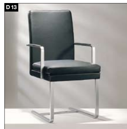
D13 Chaise rembourrée 3 variantes de piètement, 3 conforTs d'assise Beklede stoel Onderstel in 3 varianten, 3 hardheidsgraden zitting