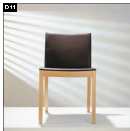
D11 Bâti en bois massif 2 hauteurs de dossier, au choix avec ou sans accoudoirs. Formes ergonomiques de l'assise et du dossier. Massief houten stoelframe Rugleuning in 2 hoogten, naar keuze met of zonder arMLEUNING. Zitting en rugleuning ergonomisch gevormd.