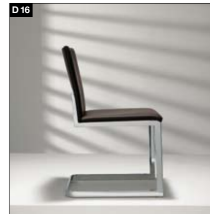
D16 Modèle de chaise avec ou sans accoudoirs/Tabouret de bar Coquille d'assise en bois façonné ou avec coquille rembourrée sur bâti métallique. Tabouret de bar au choix avec étrier ou dossier. Modelstoel met of zonder arMLEUNING/barkruk Voorgevormde houten zitschaal of gestoffeerde zitting. Barkruk naar keuze met rugbeugel of rugleuning.