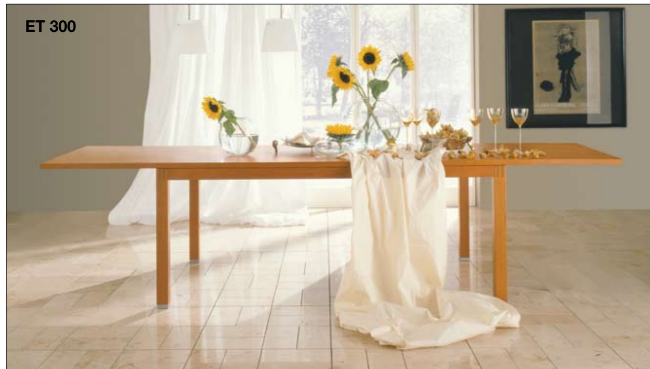
ET 300 Finitions: érable naturel, chêne nature, chêne anthracite, hêtre, merisier or, hêtre structuré, chêne choco, noyer Longueurs de table: 140, 160, 180 et 200 cm Uitvoering: blank ahorn, eiken naturel, eiken antraciet, beuken, kersen goud, structuurbeuken, eiken choco, noten Lengtes van de tafels: 140, 160, 180, 200 cm

Kunst en het ware meesterschap laten het moeilijke gemakkelijk lijken. Een tafelblad en vier tafelpoten of zelfs maar één – dat ziet er inderdaad eenvoudig uit. In werkelijkheid echter beschikken de eettafels van hülsta over tal van geraffineerde details, die van het uitgebreid tafelen een feest maken. Onze eetkamerstoelen en -fauteuils zijn comfortabel, mooi en nodigen uit tot lang nazitten.