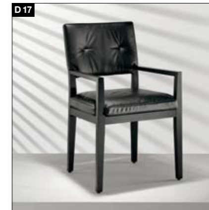
D17 Bâti en bois massif Capitonnage léger et confortable de l'assise et du dossier. En option avec accoudoirs. Massief houten stoelframe Niet strak, comfortabele, gecapitonneerde zitting en rugleuning. ArMLEUNING optioneel.