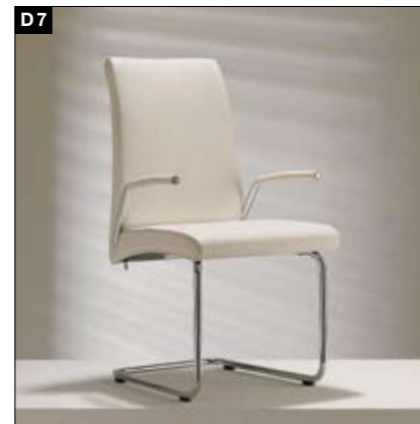
D7 Chaise à structure souple 2 hauteurs de dossier, 2 variantes d'accoudoirs, dossier avec de légers mouvements ondulatoires Buisframestoel Rugleuning in 2 hoogten, arMLEUNINGEN in 2 varianten, rugleuning kan enigszins kiepen