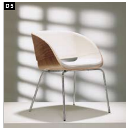
D5 Chaise coquille en bois façonné Piètement: couleur aluminium pulvérisé/chrome brillant/chrome mat/chrome noir Kuipstoel van voorgevormd hout Onderstel: aluminiumkleurig gecoat/hoogglaans chroom/mat chroom/zwart chroom