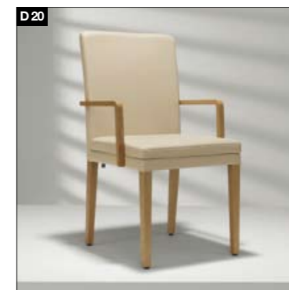
D20 Originalité phénoménale. Confort incroyable. 2 modèles diff. pour la chaise: D 20 avec bâti en bois massif ou entièrement habillée de cuir. 2 hauteurs diff. pour le dossier, 2 largeurs pour l'assise, 3 fermetés de l'assise, 2 versions pour les accoudoirs. Fenomenaal individueel. Ongelooflijk comfortabel. Twee verschillende modellen: D 20 met massief houten frame of geheel met leer bekleed. Twee rugleuninghoogtes, twee zittingbreedtes, drie types zitcomfort en twee arMLEUNINGvarianten.