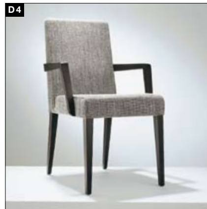
D4 Piètement: bois massif 2 hauteurs de dossier, 2 variantes d'accoudoirs, structure élastique de sangles tressées Onderstel: massief hout Rugleuning in 2 hoogten, arMLEUNINGEN in 2 varianten. Duurzaam elastische, gevlochten bandvering.