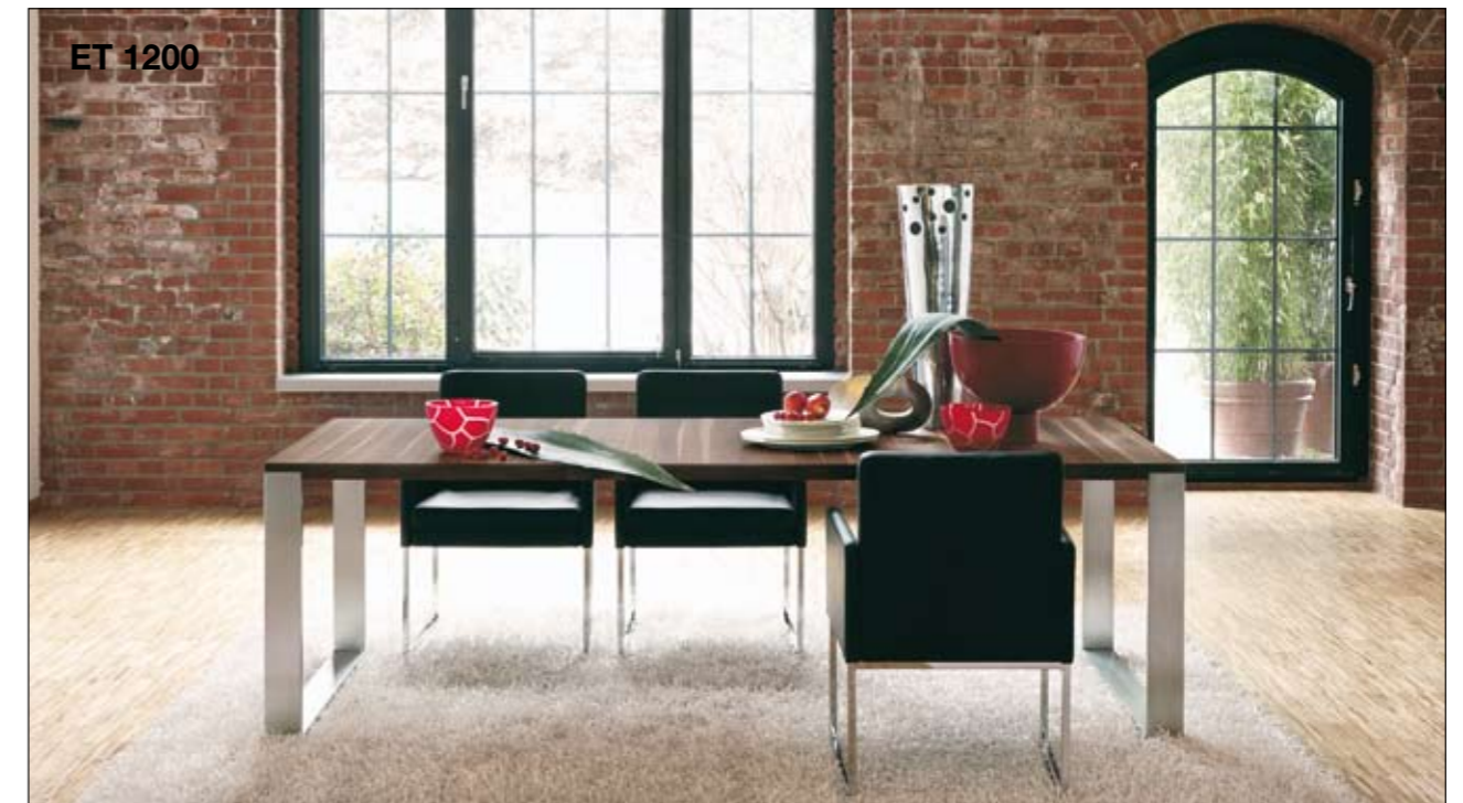
ET 1200 Finitions: laqué blanc, noyer, hêtre structuré, chêne anthracite Longueurs de table: 185 et 245 cm Tailles des plateaux de table: 2 tailles fixes, 2 tailles à rallonge (les tables sont rallongées de 100 cm) Chaises: D 13 Uitvoering: wit laqué, noten, structuurbeuken, eiken antraciet Tafellengtes: 185 en 245 cm Tafelafmetingen: 2 vaste groottes, 2 groottes om uit te trekken (tafels kunnen 100 cm verlengd worden) Stoelen: D 13