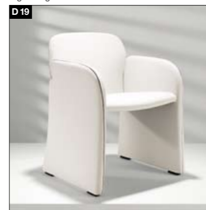
D19 Fauteuil rembourré Cadre du siège avec sangles tressées, rembourrage en mousse froide PU de grande qualité, dossier souple, bâti en bourrelet en coton. Gestoffeerde eetfauteuil Zittingframe met gevlochten singels, stoffering van hoogwaardig PU-koudschuim, verende rugleuning, steprand van geribde stof.