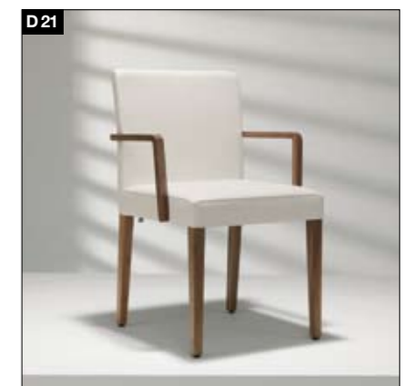
D21 Bâti en bois massif 2 hauteurs pour le dossier (85,5 cm et 94,5 cm), avec ou sans acc. en bois, rembourrage sur une structure formée de sangles élastiques, dossier avec acier à ressort: absorption de la pression et adaptation aux formes du corps. Le rembourrage garantit une assise confortable. Massief houten stoelframe Twee rugleuninghoogtes (85,5 en 94,5 cm), met/zonder houten frame of geheel met leer bekleed. Twee rugleuninghoogtes, twee zittingbreedtes, drie types zitcomfort en twee arMLEUNINGvarianten. Gegarandeerd buitengewoon comfortabel zitten.