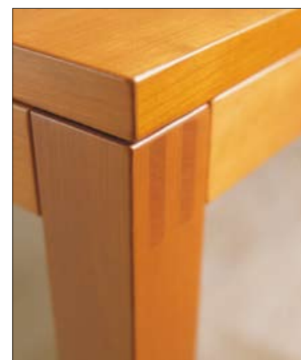
Une galvanisation élaborée du piétement et un façonnage soigné sont les caractéristiques qui rendent la ET 300 si précieuse. De ambachtelijke pen- en gatverbindingen van het onderstel en de zorgvuldig afgewerkte kanten zijn de hülsta-kenmerken, die de ET 300 zo waardevol maken.