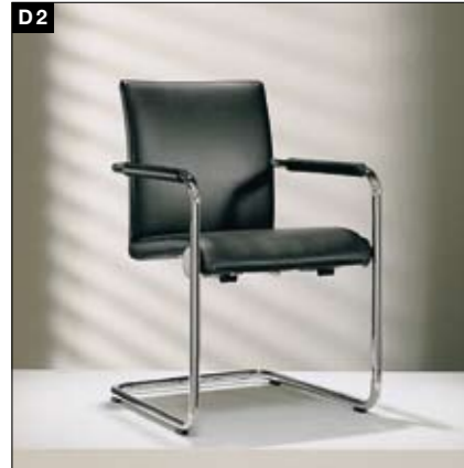
D2 Chaise à structure souple En option: fonction Easy-glider (inclinaison du dossier variable grâce au déport du poids) Buisframestoel Optioneel: Easy-glider-functie (de stand van de rugleuning past zich aan door te veranderen van zithouding)