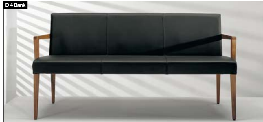
D 4 banc Piètement: bois massif; 4 largeurs, 2 hauteurs de dossier D 4 bank Onderstel: massief hout; 4 breedtes, rugleuning in 2 hoogtes