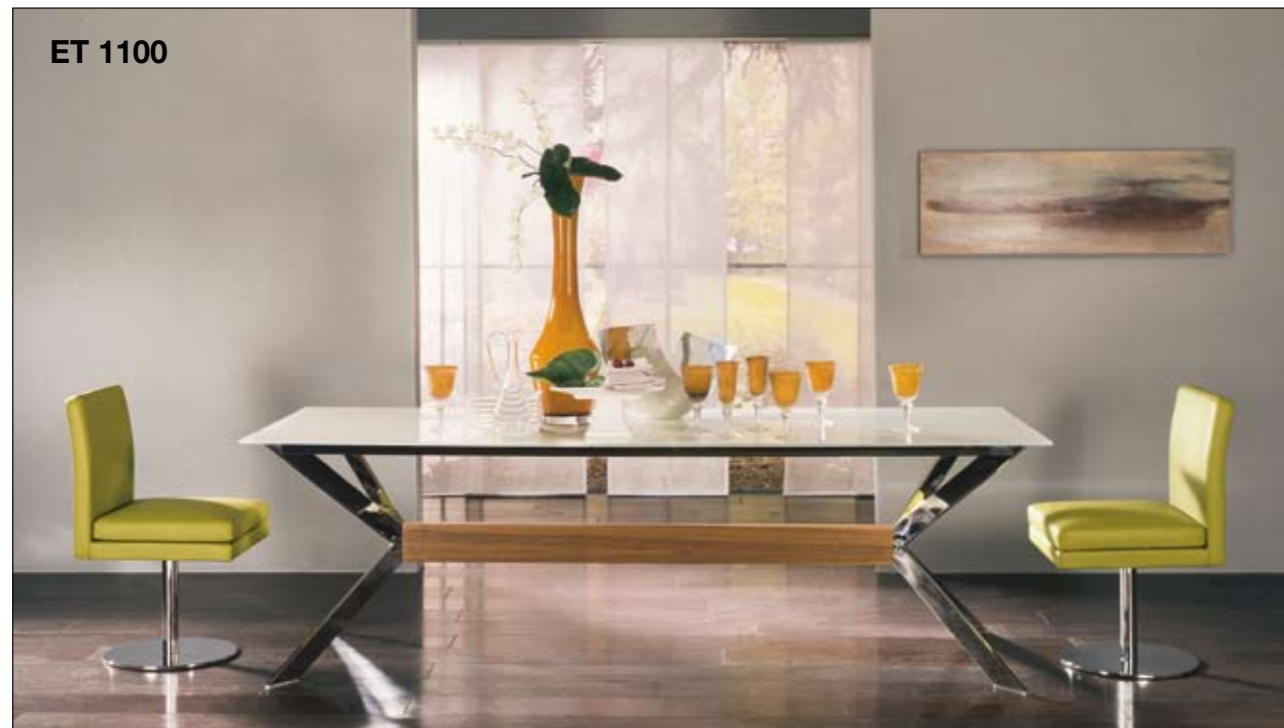
ET 1100 Finition: noyer Longueurs de table: 200, 240 et 220 cm (plateau de table ovale, Ø 145 cm/plateau de table rond) Chaises: D 13 Uitvoering: noten Lengtes van de tafels: 200, 240 cm en 220 cm (ovaal tafelblad, Ø 145 cm/rond tafelblad) Stoelen: D 13